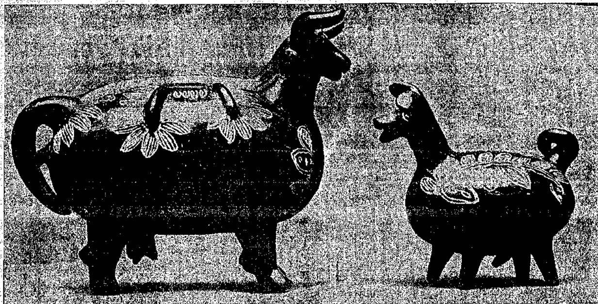
Cerámica de Quinchamalí

Aprendamos con esta exposición la aspereza y la dulzura de los que no tienen nombre, y a ese silencio de nuestra raza demos con todo el corazón rosa y paloma, palabray esperanza, porque el pueblo no tiene nada y todo lo merece.