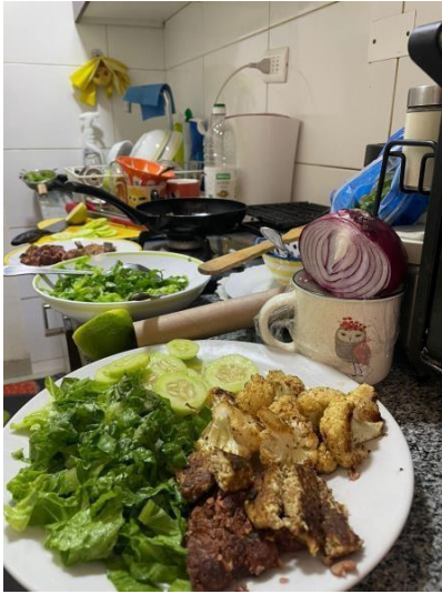
Figura 3 Preparación del almuerzo