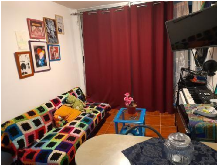
Figura 2 Retrato de hogar de Aimar y Mónica