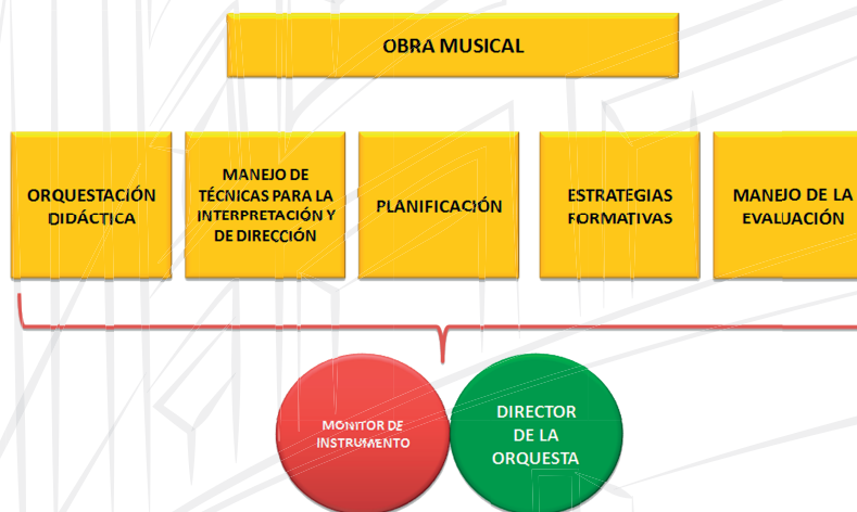
Figura N° 3

Si bien es cierto, lo propuesto parece una idealización, también es cierto que existen profesionales que, tal vez sin una sistematización profesional, han desarrollado su actividad orquestal más o menos dentro de criterios similares, obteniendo logros en todos los ámbitos posibles: formativos, artísticos y sociales.