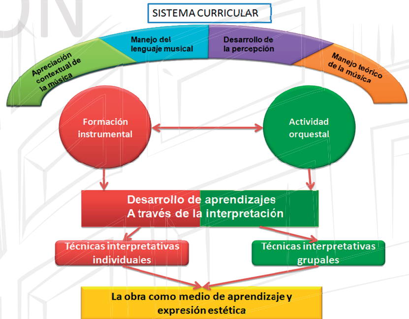
Figura N° 1 10

Cabe mencionar, sin entrar en la descripción de cada una de las dimensiones de este modelo, que en esta visión la obra no es necesariamente una meta o un logro, sino un fin interpretativo y expresivo tanto para el músico en formación como para la audiencia. Sin perjuicio de esto, la obra estará diseñada en función del desarrollo de aprendizajes musicales propios de las diferentes áreas de este sistema curricular, es decir,